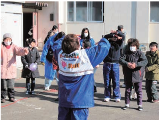
仙台市浦町中学校