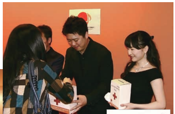
コンサート後の募金活動