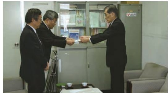
日本赤十字社への義援金寄託

また、合わせて当社グループ内において被災した従業員や講師、生徒のための義援金を募り、支援を行っております。