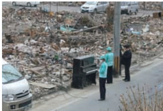
津波で流されたピアノ

4月初旬には、緊急対策本部長、国内営業本部長らが被災地を訪問しました。会社施設の被災状況を確認するとともに、現地の従業員や講師らと当面の要望や今後の課題など、時間をかけて直接対話をしました。