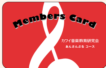
あんさんぶるコース

ご入会された皆様へは会員証をお送りいたします。会員としての特典をご利用の際は本証をご提示ください。