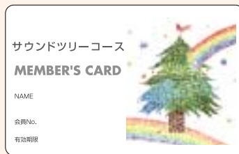
サウンドツリー コース