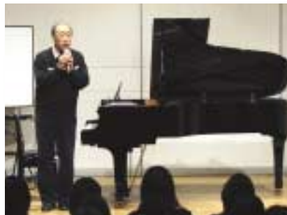
青島広志 トキメキピアノレクチャー